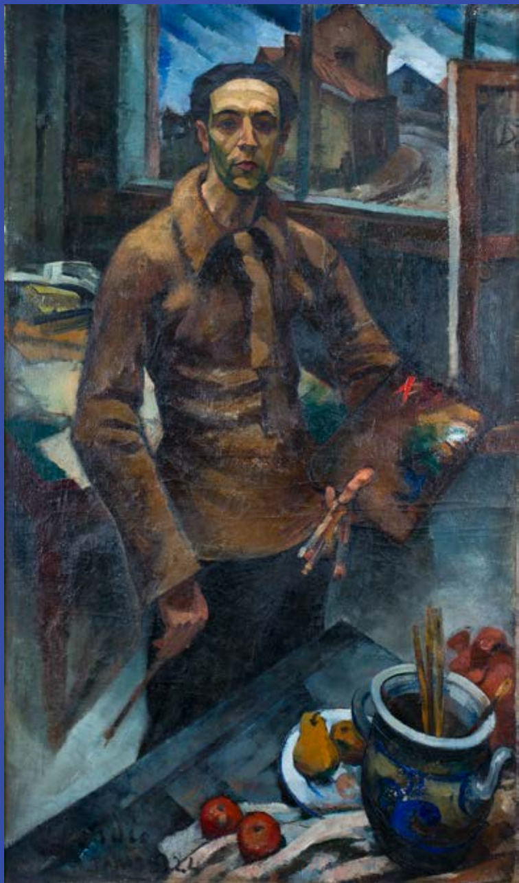
Grande auto-retrato da natureza morta, 1924 Óleo sobre tela, 149 x 90 cm Coleção particular